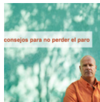
10 consejos para no perder el paro