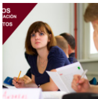
Cursos INEM 2017