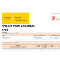
Solicitar certificado de vida laboral