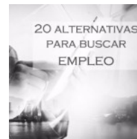
20 modos eficaces de buscar empleo