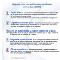
Nuevas medidas de apoyo a emprendedores y autónomos